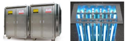
UV 光解催化設備 紫外線光催化淨化設備