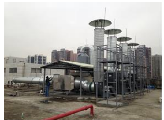
紫外線光催化系統及排放口

VOC會增強大氣氧化性,促使霧霾的形成,造成空氣污染問題。近年來,包裝印刷業產生的空氣污染已引起了政府高度重視,成為有機廢氣排放的重點監控行業之一。面對日漸嚴謹的排放標準,工廠須尋找有效處理VOCs的方法。